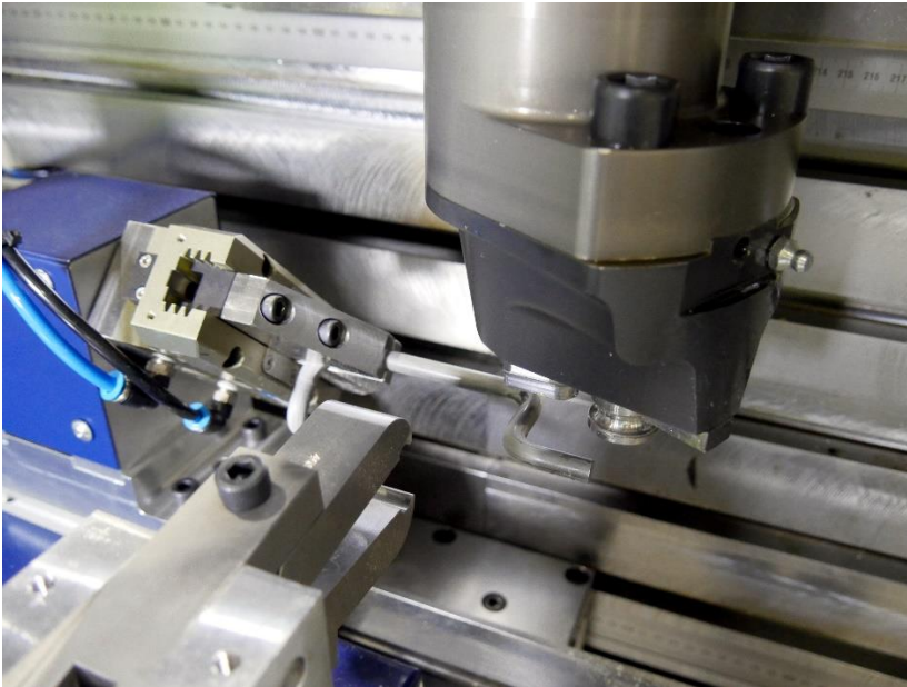
Bearbeitungsstation 2