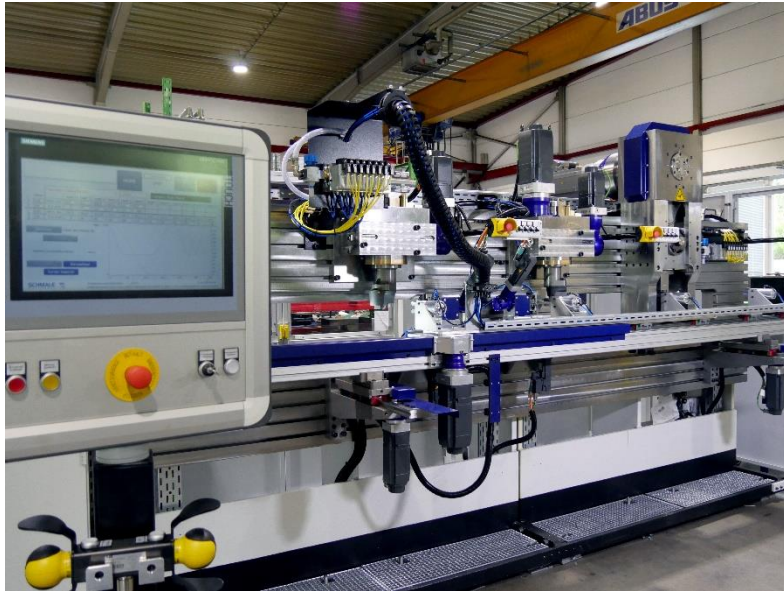
Die X2000NC mit Fingerbiegestationen und Lineartransfer