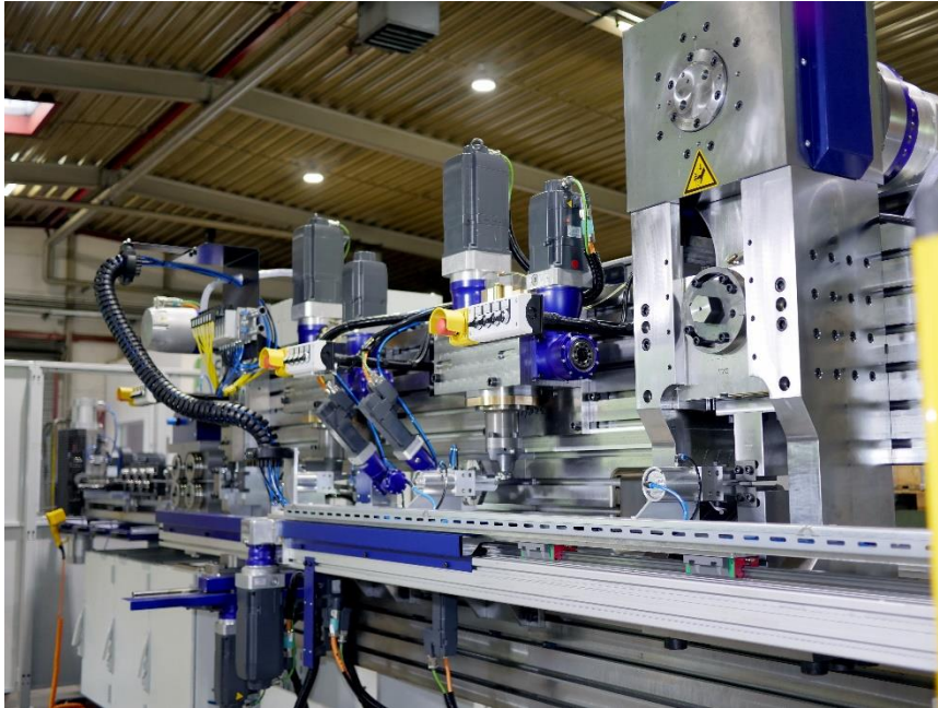
Die X2000NC mit Fingerbiegetechnik und optionaler Servopresse